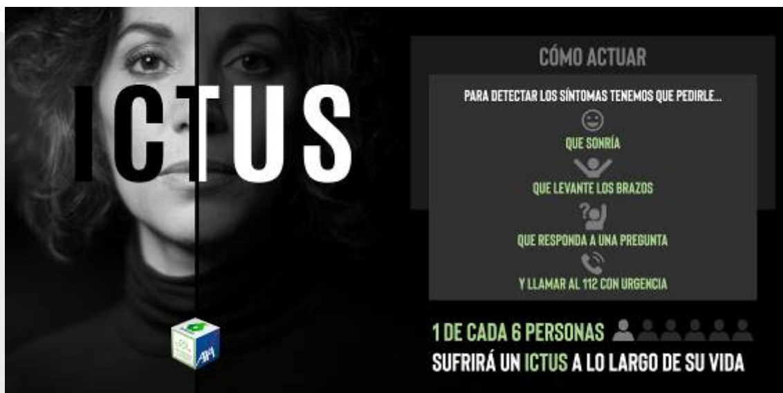
Una de las infografías de la campaña Constantes y Vitales sobre el Ictus