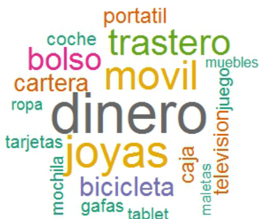
Palabras más usadas por los asegurados de los objetos robados