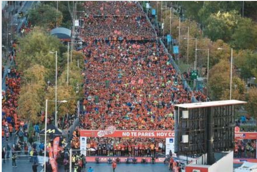
Imágenes de la carrera PONLE FRENO celebrada el año pasado en Madrid

La cita será este domingo, 25 de noviembre PONLE FRENO hace historia al cumplir 10 años de su carrera en Madrid dedicada a las víctimas de tráfico